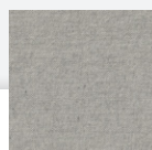
JR4 : GRAFITO