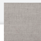
JR5 : NATUREL