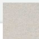
JR3 : CENIZA